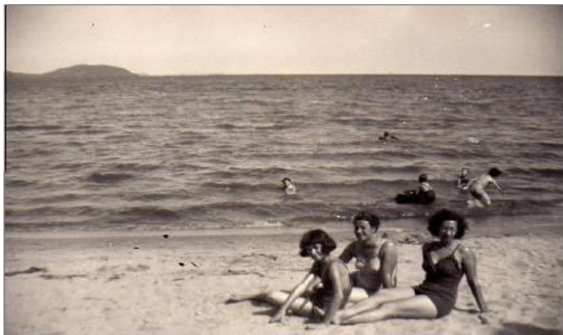
Figura 7 – Família da Praia de Ipanema/1953