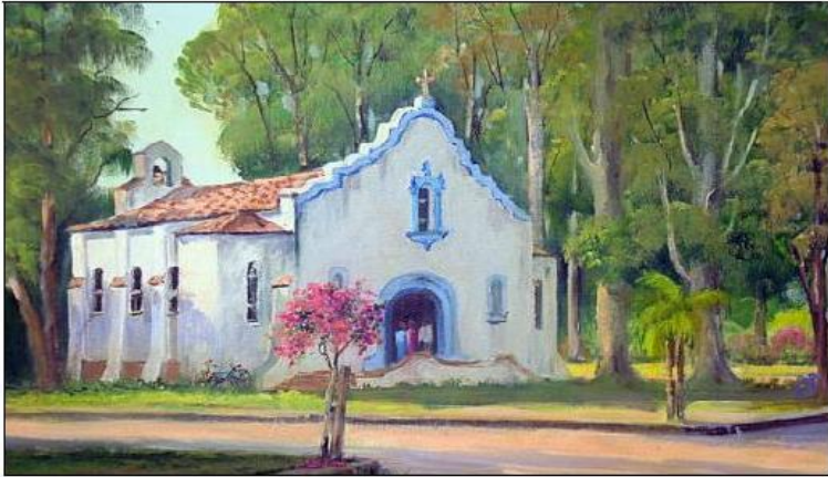
Figura 5 - Ilustração de Carlos R. Rosa/ Capela Nossa Senhora Aparecida em 1937

Fonte: HISTÓRICO do Santuário de Nossa Senhora Aparecida.