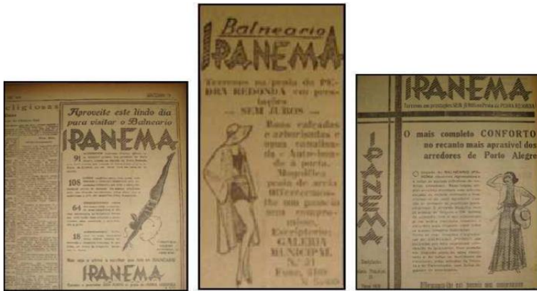
Figura 8 - Anúncios divulgando o Balneário Ipanema/1930