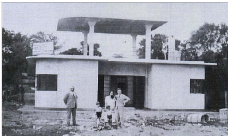
Figura 4 - Casa de Coufal em construção/Ipanema/1931